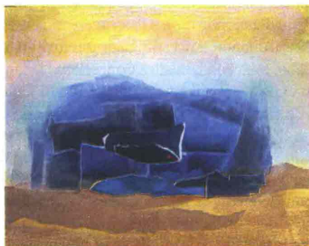
Domenica Regazzoni Lucio Dalla a 4 mani

Sala d'Ercole di Palazzo d'Accursio. Dal 28 febbraio al 19 marzo