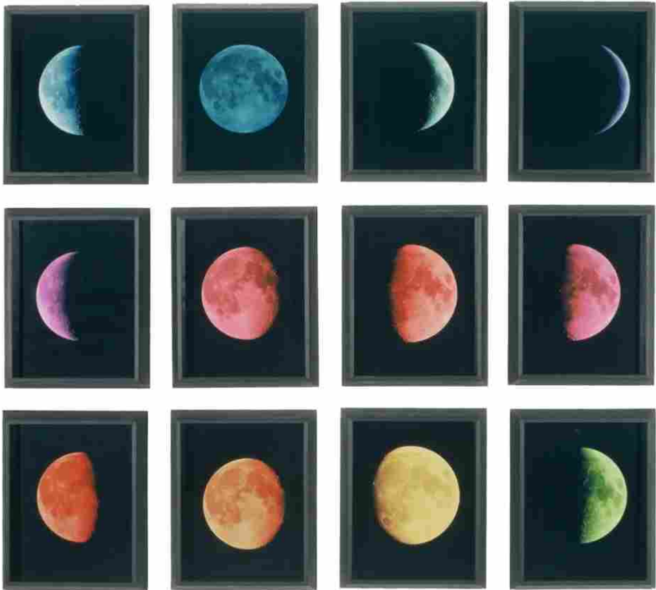
Luca Missoni, Moon 2001