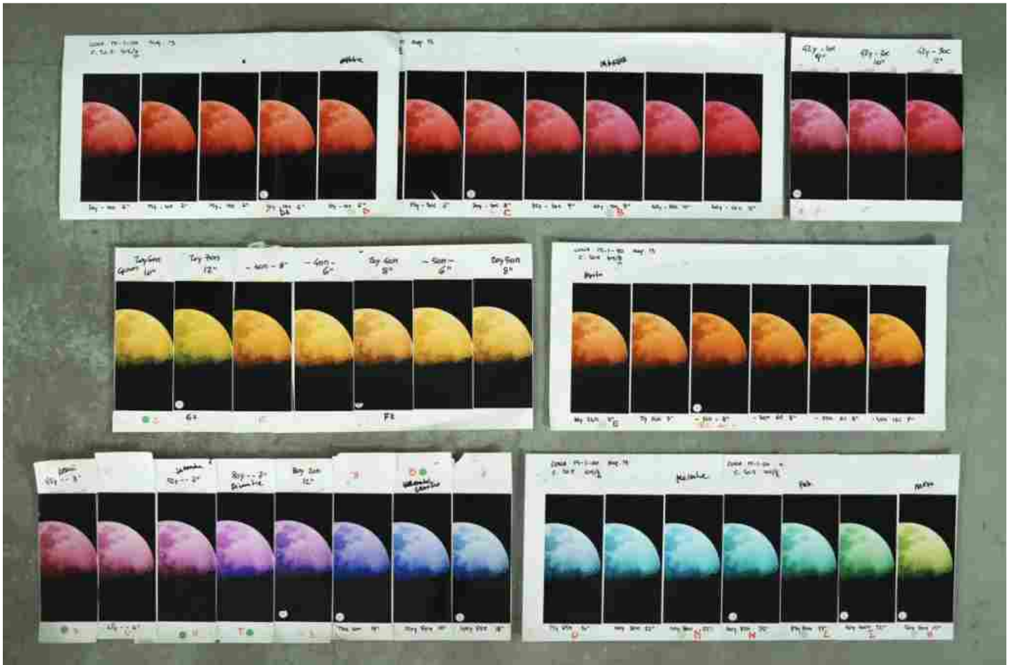
Luca Missoni, Coloroteca della Luna, variazioni cromatiche generate in camera oscura da un unico negativo